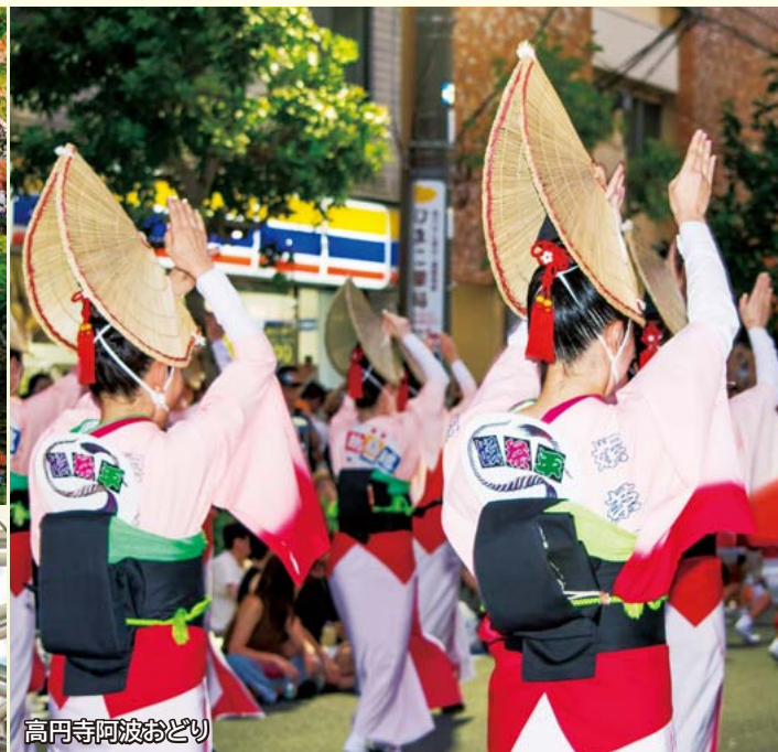
高円寺阿波おどり