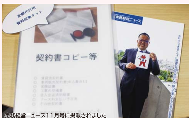
実務経営ニュース11月号に掲載されました

材・人間関係に関する悩みが多いということ。在宅ワーカーの採用、テレワークの導入など多様な働き方も同友会で得た知恵を取り入れながら、考えていこうと思っています。