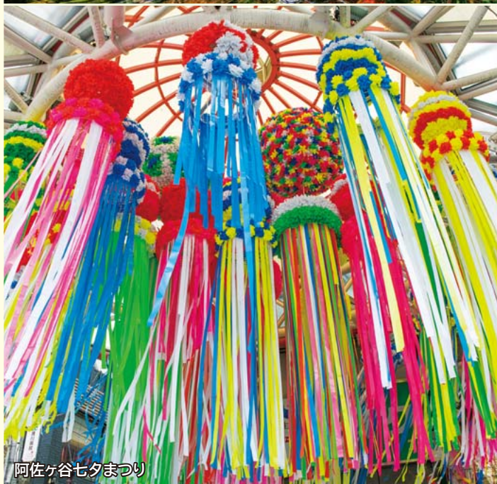
阿佐ヶ谷七夕まつり